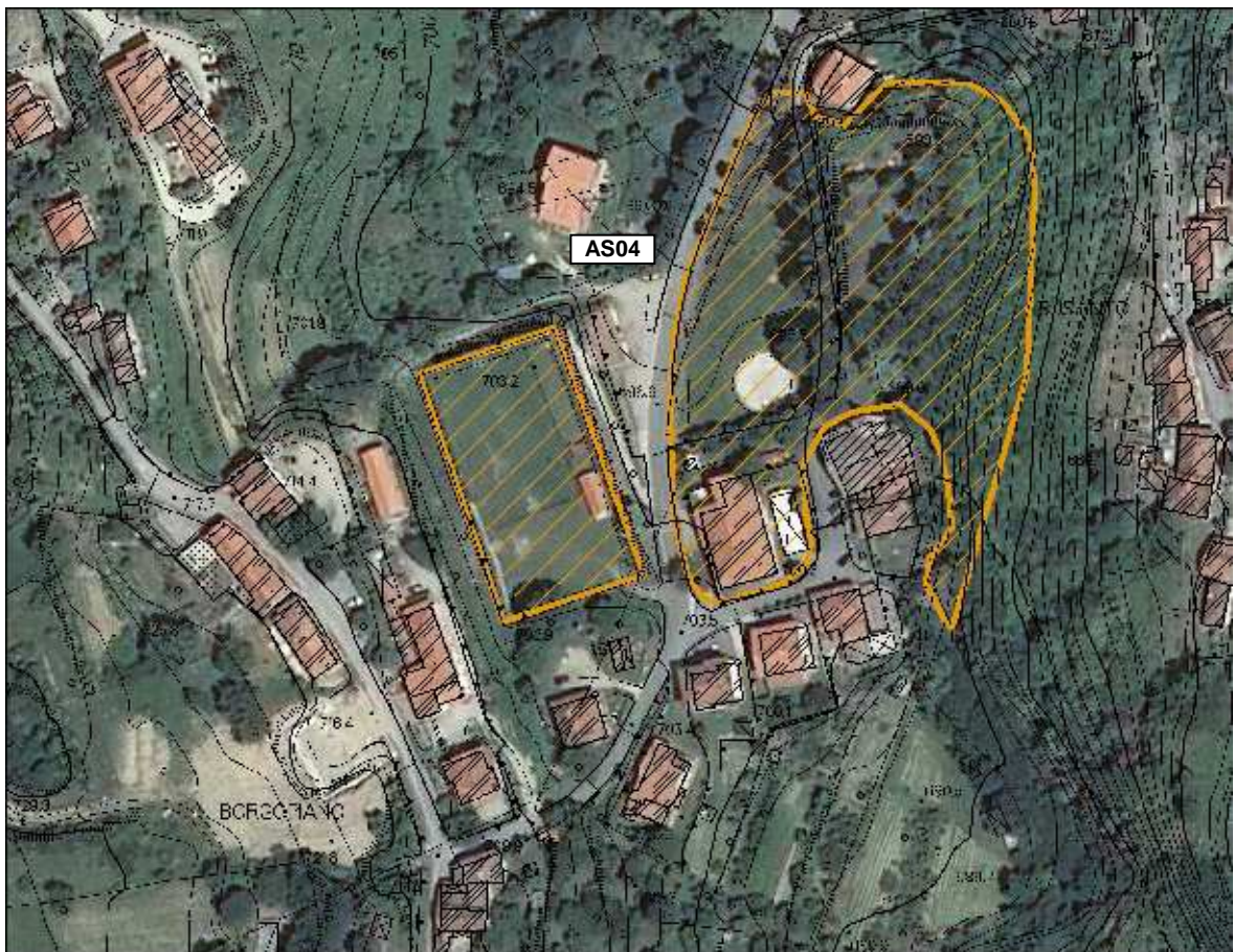
Area Ammassamento Soccorritori – Area Verde e Sportiva Cetica – vista aerea