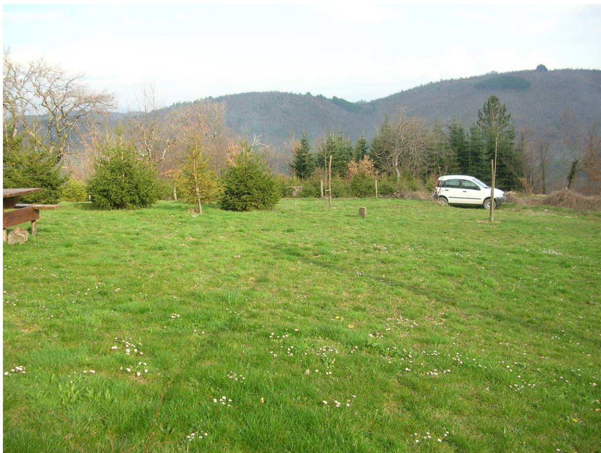
Area Attesa popolazione– Sagrato Chiesa San Pancrazio