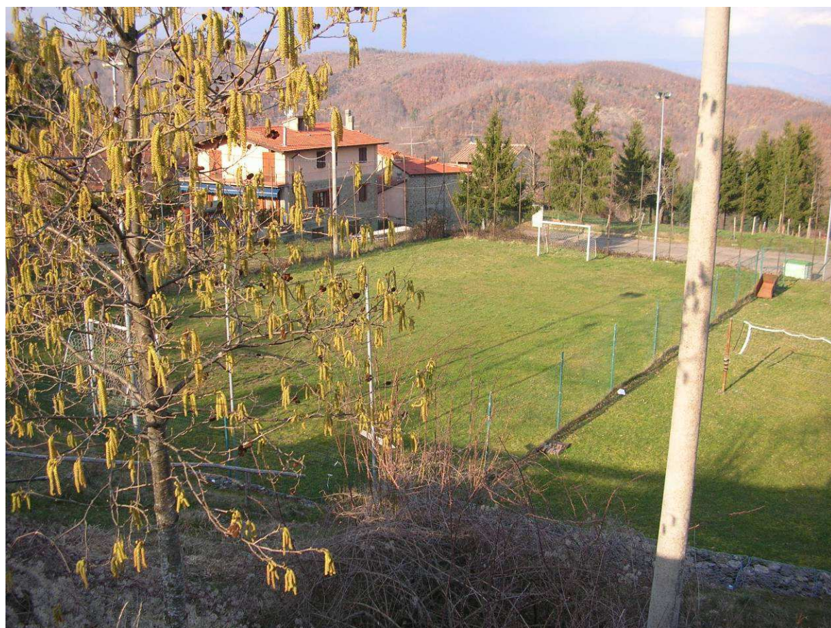
Area Ricovero Popolazione– Campo Sportivo Caiano