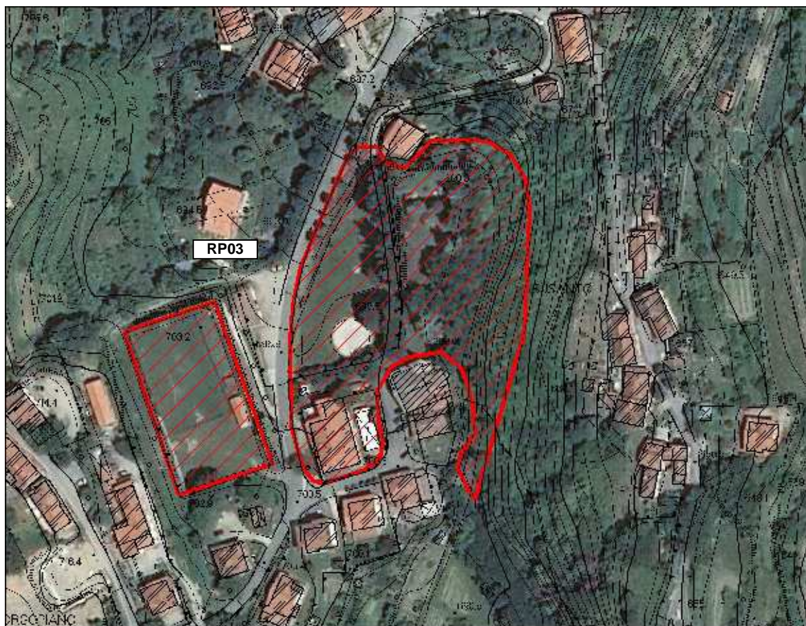
Area Ricovero Popolazione– Area verde e Sportiva Cetica – vista aerea