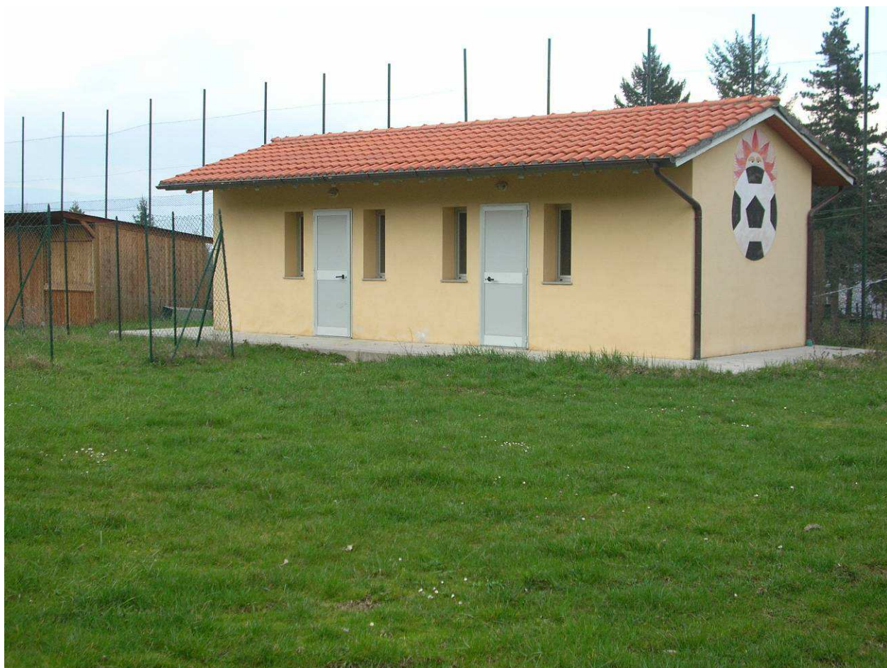
Area Ricovero Popolazione 03R – Area verde e Sportiva Cetica - Spogliatoi