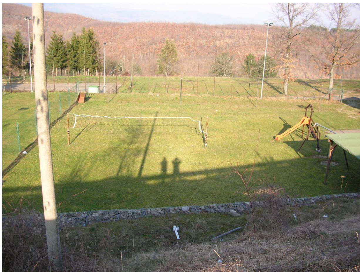
Area Ricovero Popolazione– Campo Sportivo Caiano