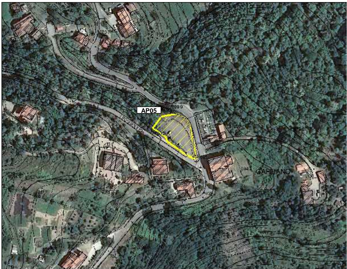
Area Attesa Popolazione- Parcheggio Garliano – vista aerea