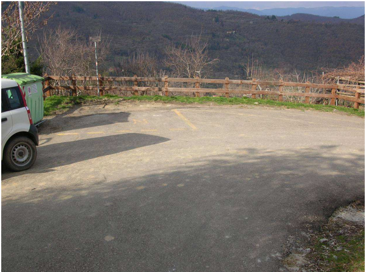
Area Attesa Popolazione - Parcheggio Valgianni