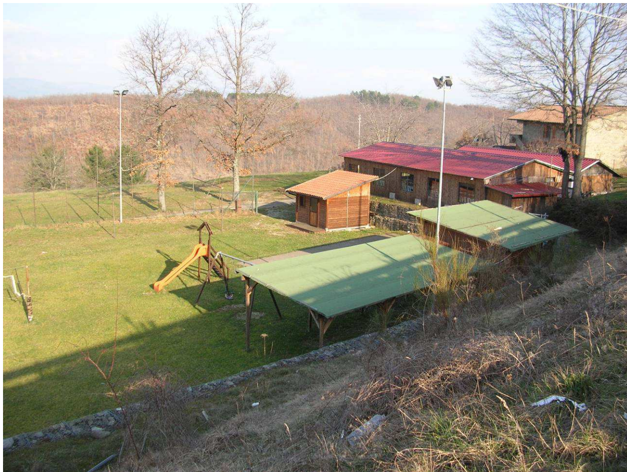
Area Ricovero Popolazione– Campo Sportivo Caiano