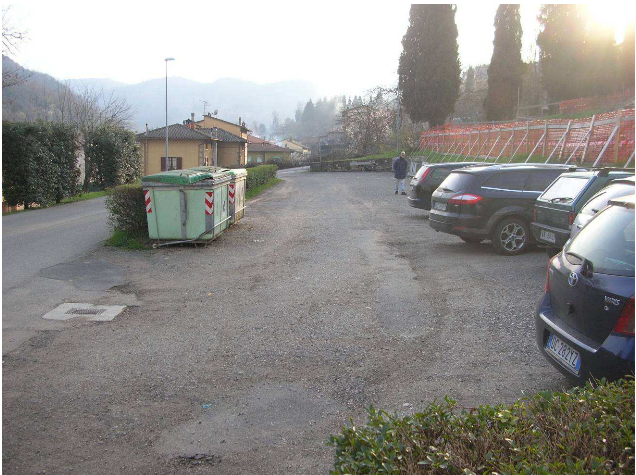
Area Attesa Popolazione– Piazza Scuola Media Strada