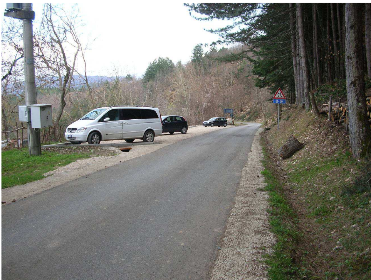
Area Attesa Popolazione - Parcheggio Valgianni