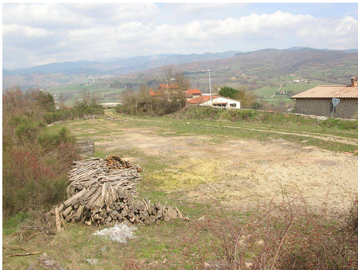
Area Attesa Popolazione– Area ex Cave