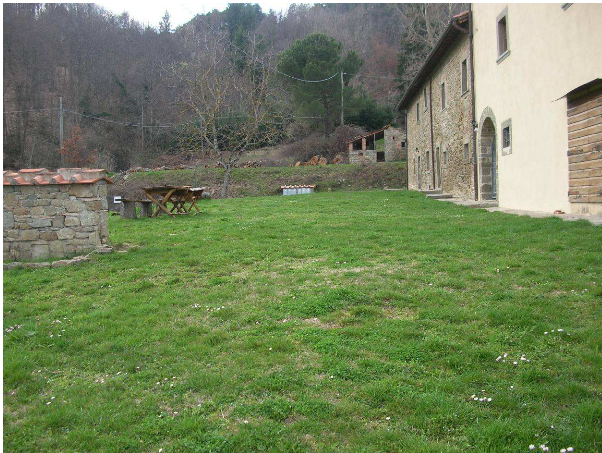
Area Attesa popolazione– Sagrato Chiesa San Pancrazio