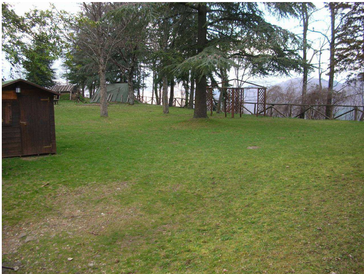
Area Attesa Popolazione– Area verde e Sportiva Cetica – Area Verde