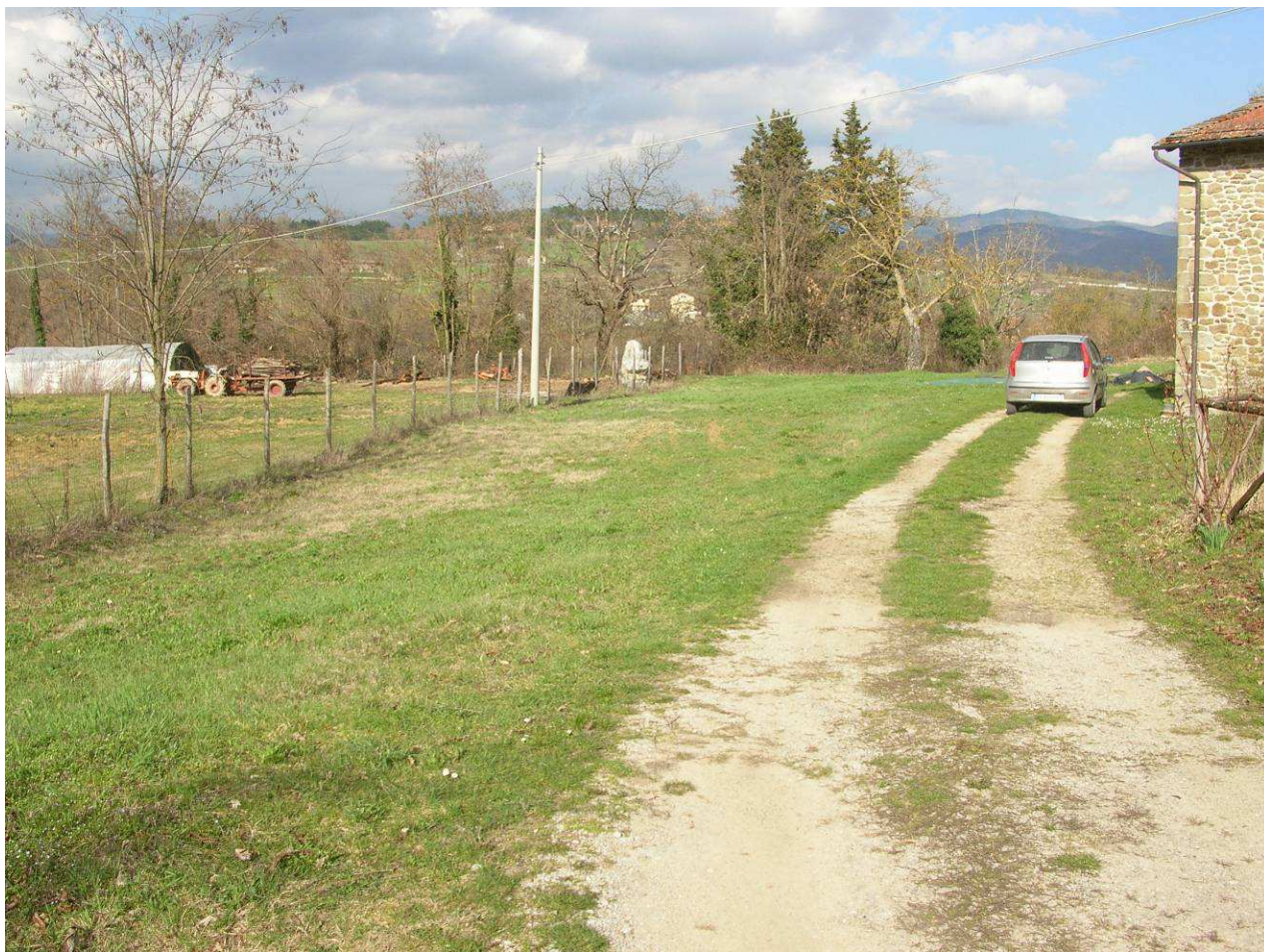
Area Attesa Popolazione - Sagrato Chiesa