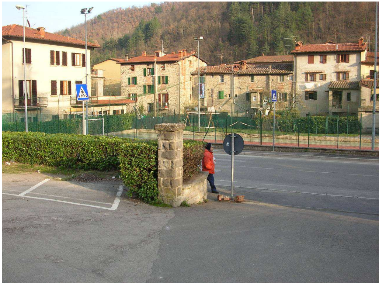
Area Attesa Popolazione– Piazza Scuola Media Strada