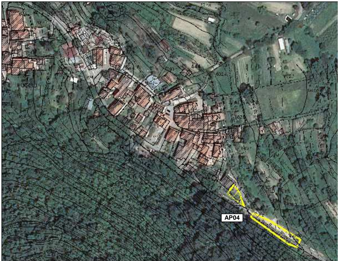
Area Attesa Popolazione - Parcheggio Valgianni – vista aerea