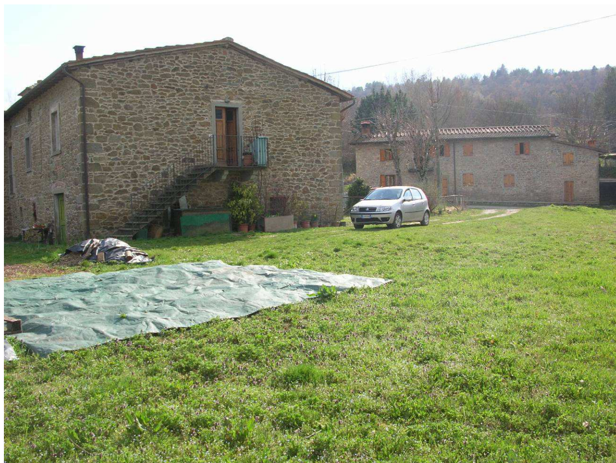
Area Attesa Popolazione - Sagrato Chiesa