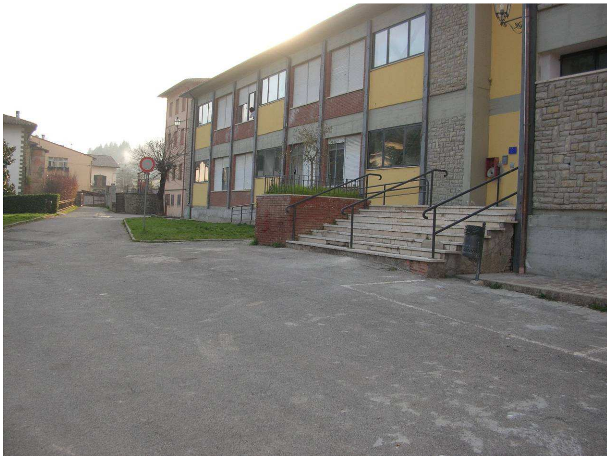
Area Attesa Popolazione– Piazza Scuola Media Strada