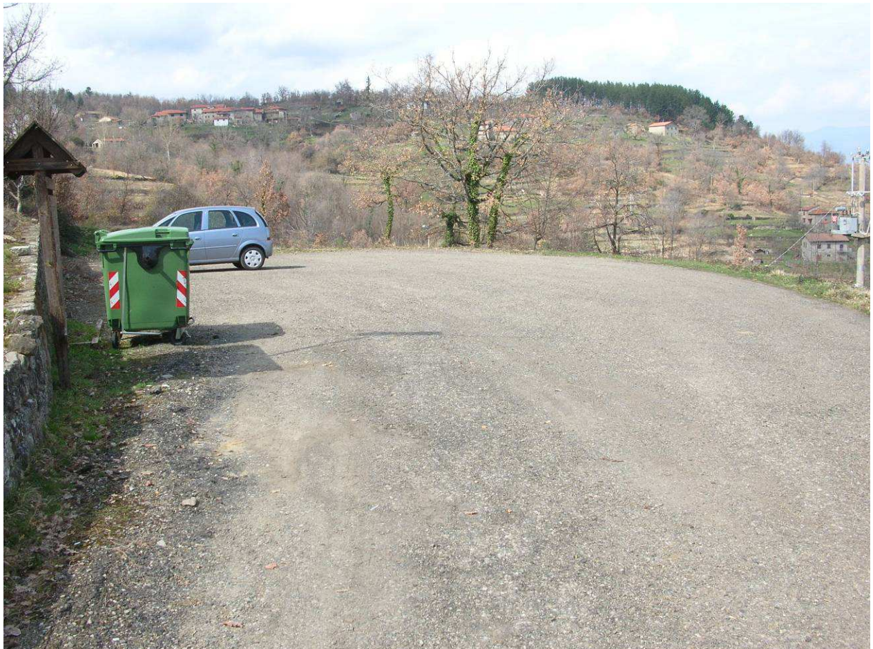
Area Attesa Popolazione- Parcheggio Garliano