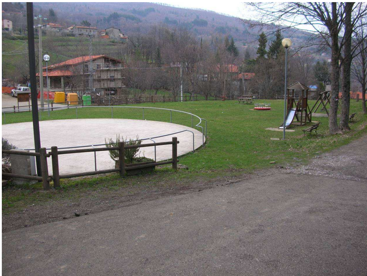
Area Ricovero Popolazione 03R – Area verde e Sportiva Cetica – Area Verde