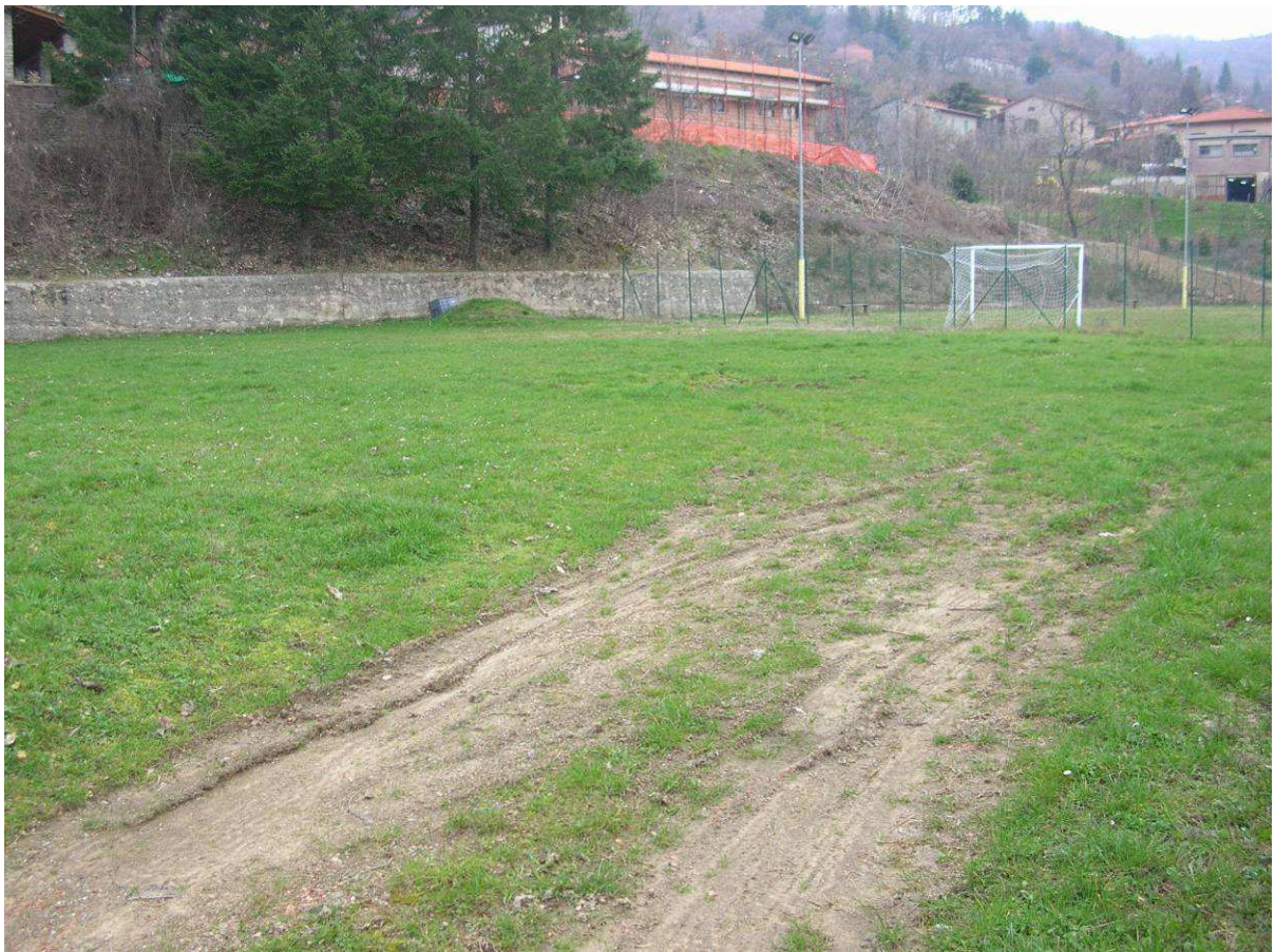
Area Attesa Popolazione– Area verde e Sportiva Cetica – Campo sportivo