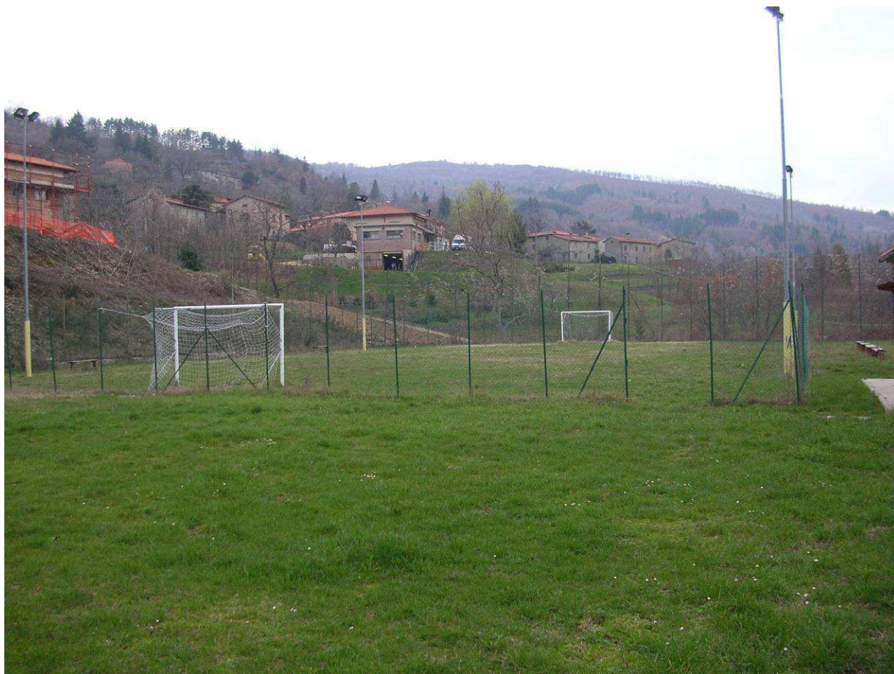
Area Ricovero Popolazione 03R – Area verde e Sportiva Cetica – Campo sportivo