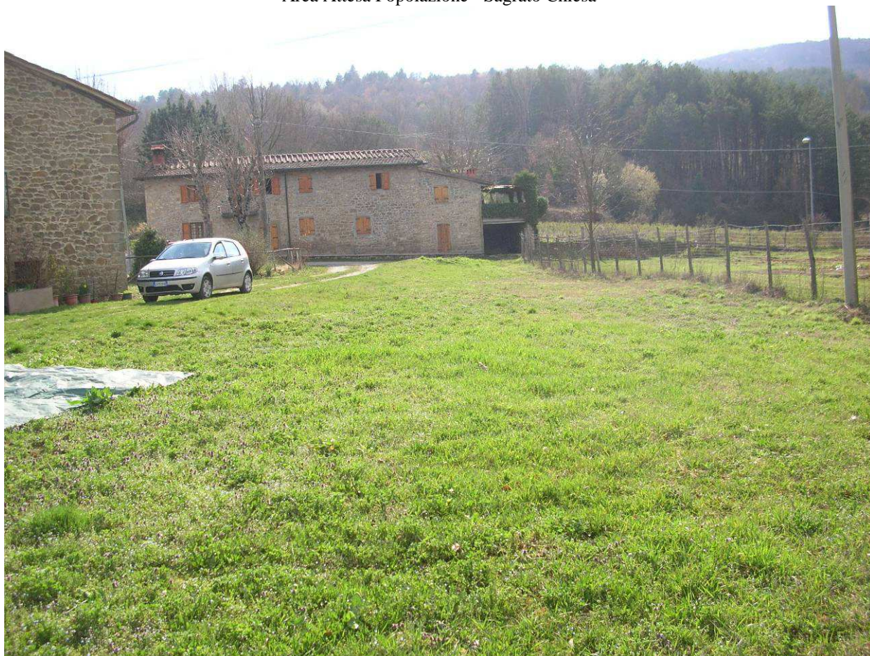
Area Attesa Popolazione - Sagrato Chiesa