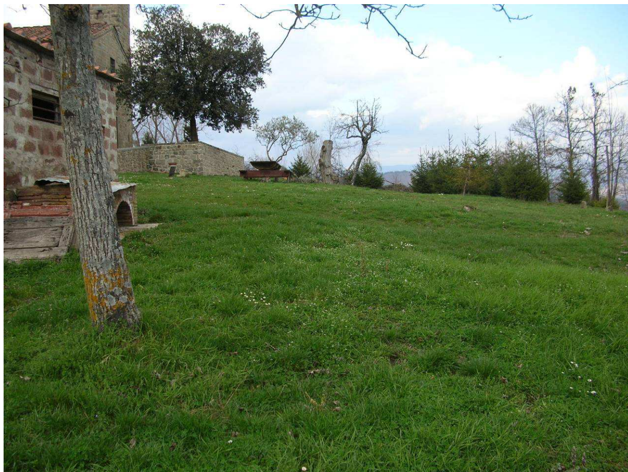
Area Attesa popolazione– Sagrato Chiesa San Pancrazio