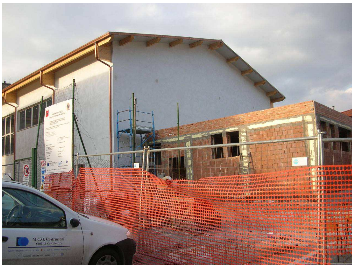
Area Attesa Popolazione– Piazza Scuola Media Strada - Palestra