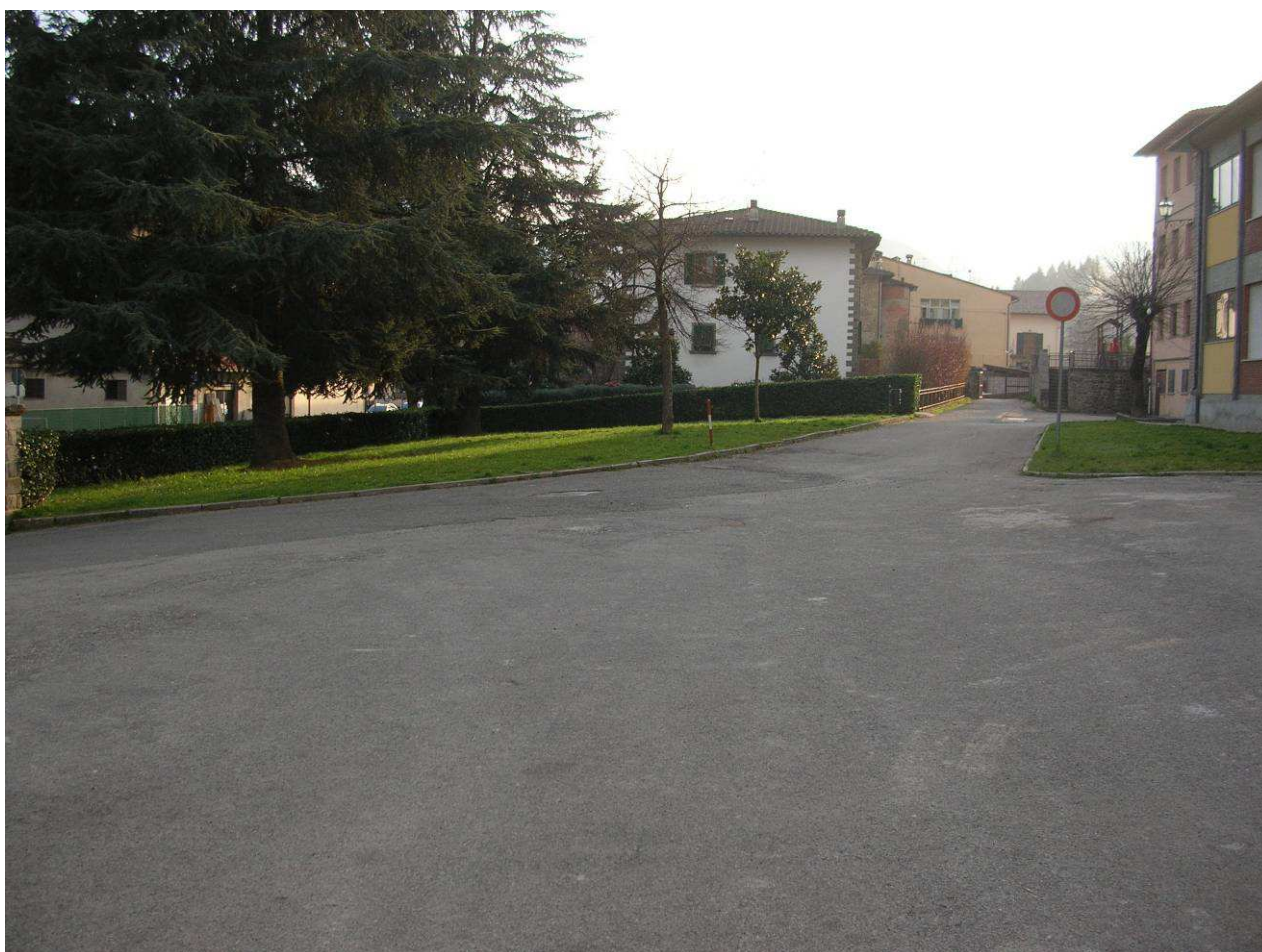
Area Attesa Popolazione– Piazza Scuola Media Strada