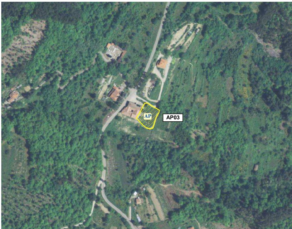
Area Attesa popolazione– Sagrato Chiesa San Pancrazio – vista aerea