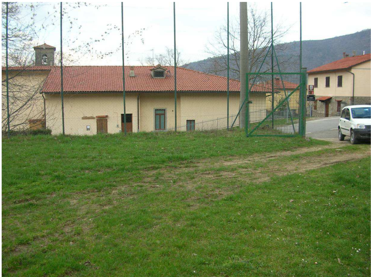
Area Ricovero Popolazione 03R – Area verde e Sportiva Cetica – Area Verde