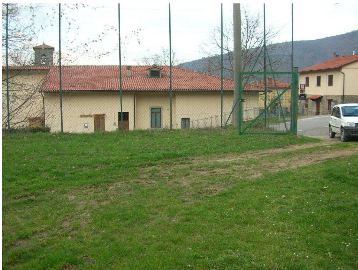
Area Ricovero Popolazione– Area verde e Sportiva Cetica – Area Verde