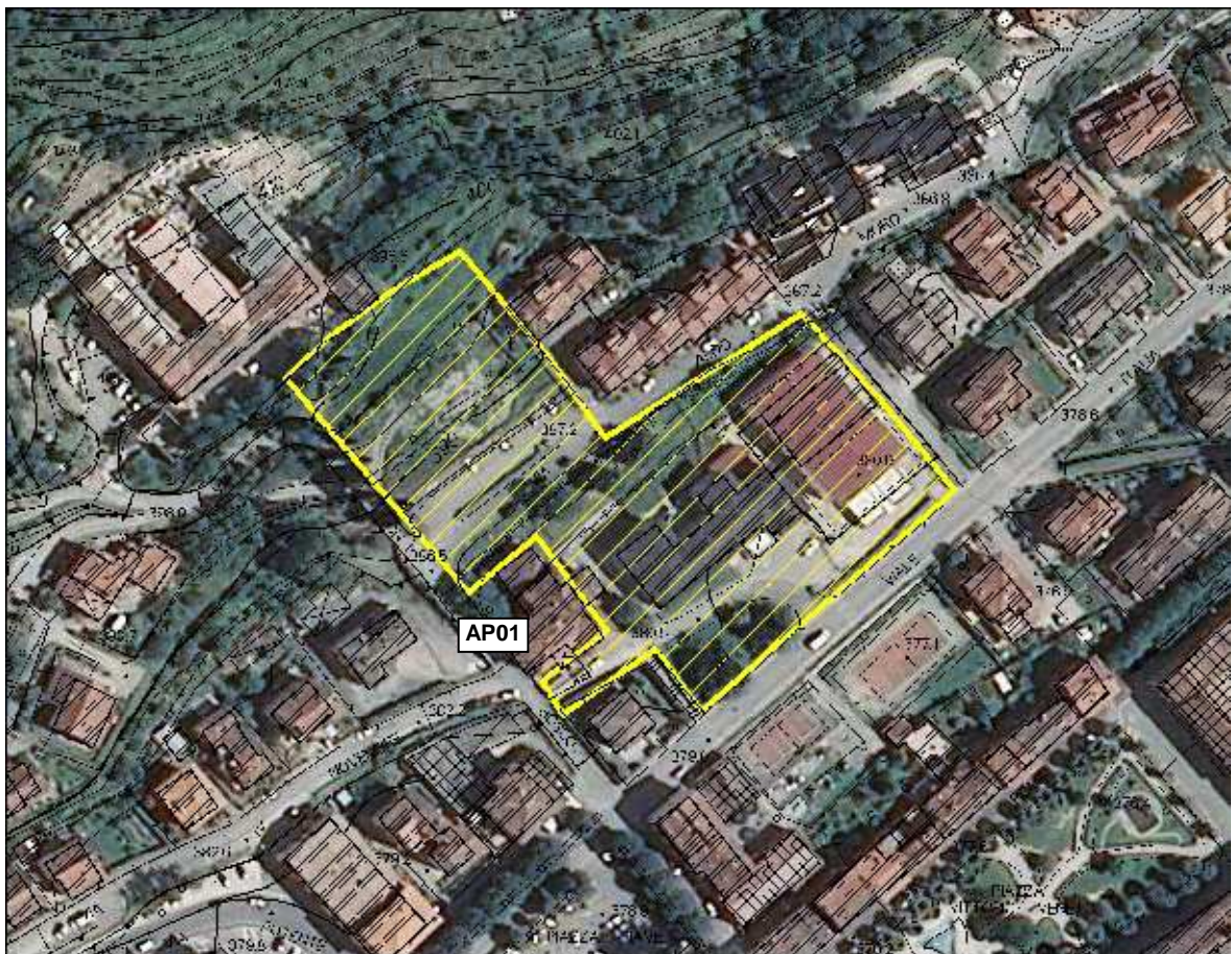
Area Attesa Popolazione– Piazza Scuola Media Strada – vista aerea