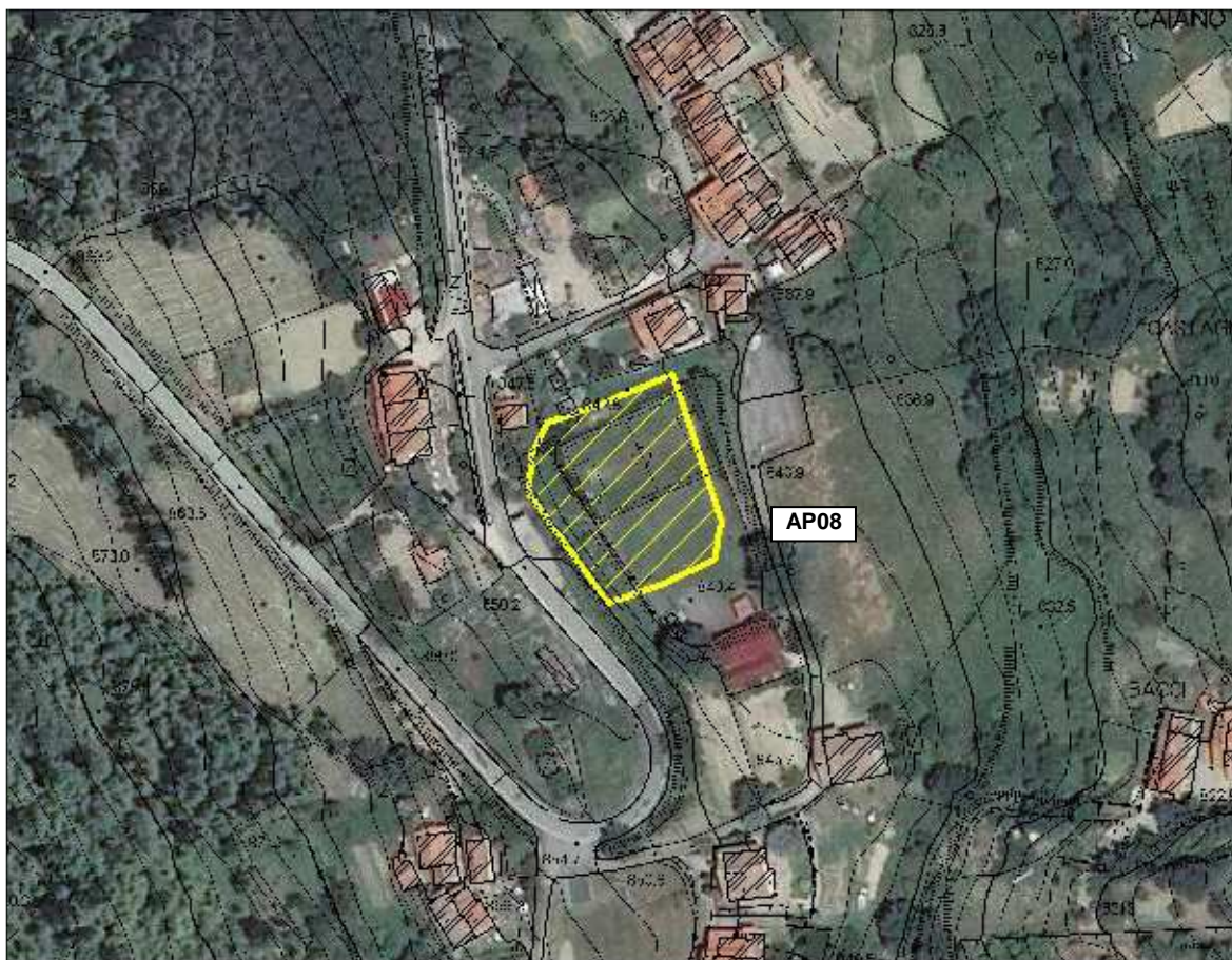
Area Attesa Popolazione – Campo Sportivo Caiano – vista aerea