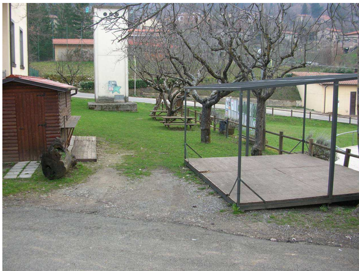
Area Ricovero Popolazione 03R – Area verde e Sportiva Cetica – Area Verde