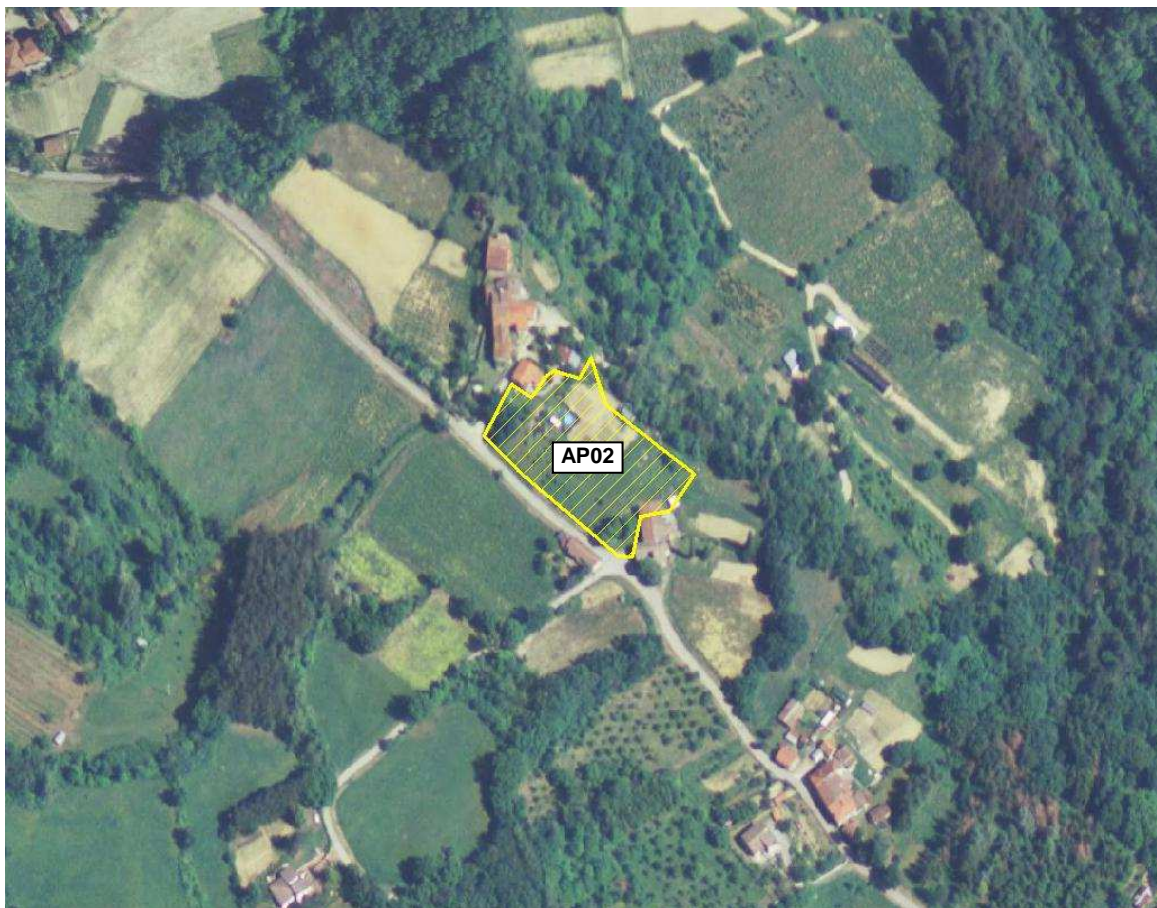
Area Attesa Popolazione - Sagrato Chiesa – vista aerea