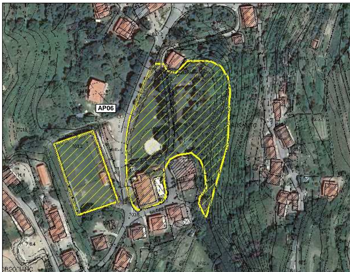
Area Attesa Popolazione- Area verde e Sportiva Cetica – vista aerea