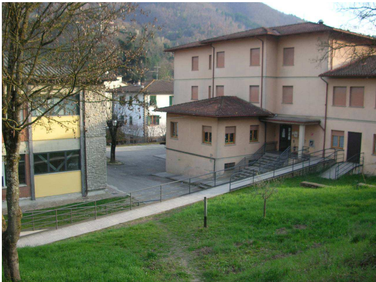
Area Attesa Popolazione– Piazza Scuola Media Strada