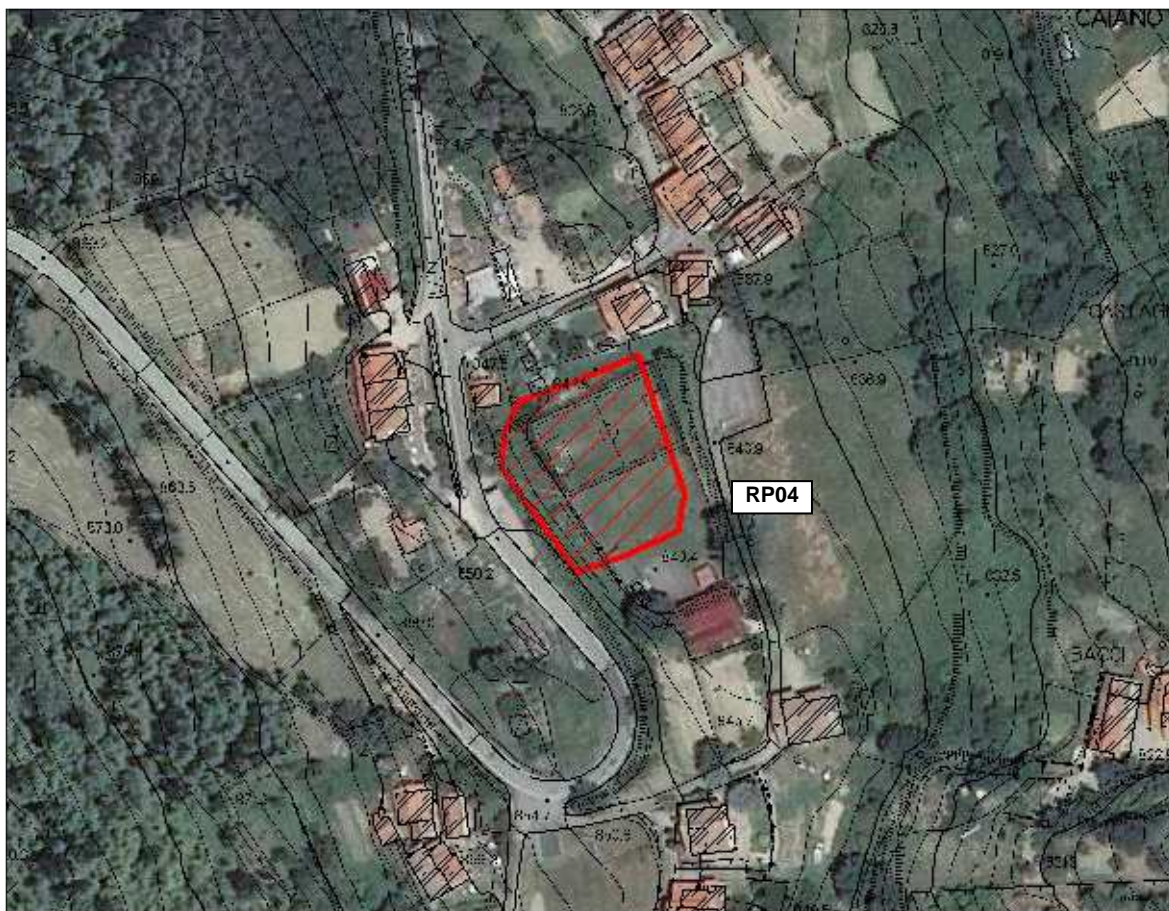
Area Ricovero Popolazione – Campo Sportivo Caiano – vista aerea