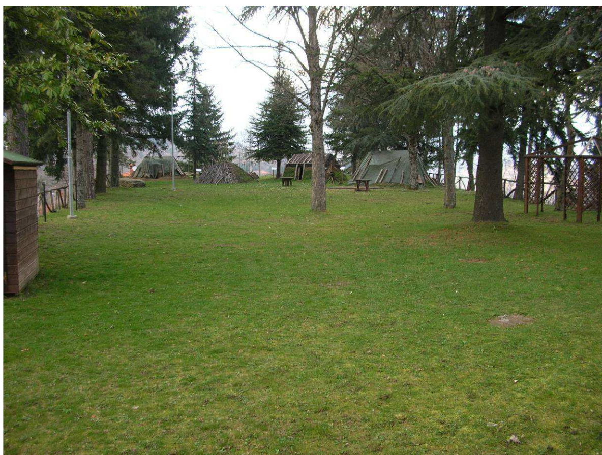
Area Attesa Popolazione– Area verde e Sportiva Cetica – Area Verde