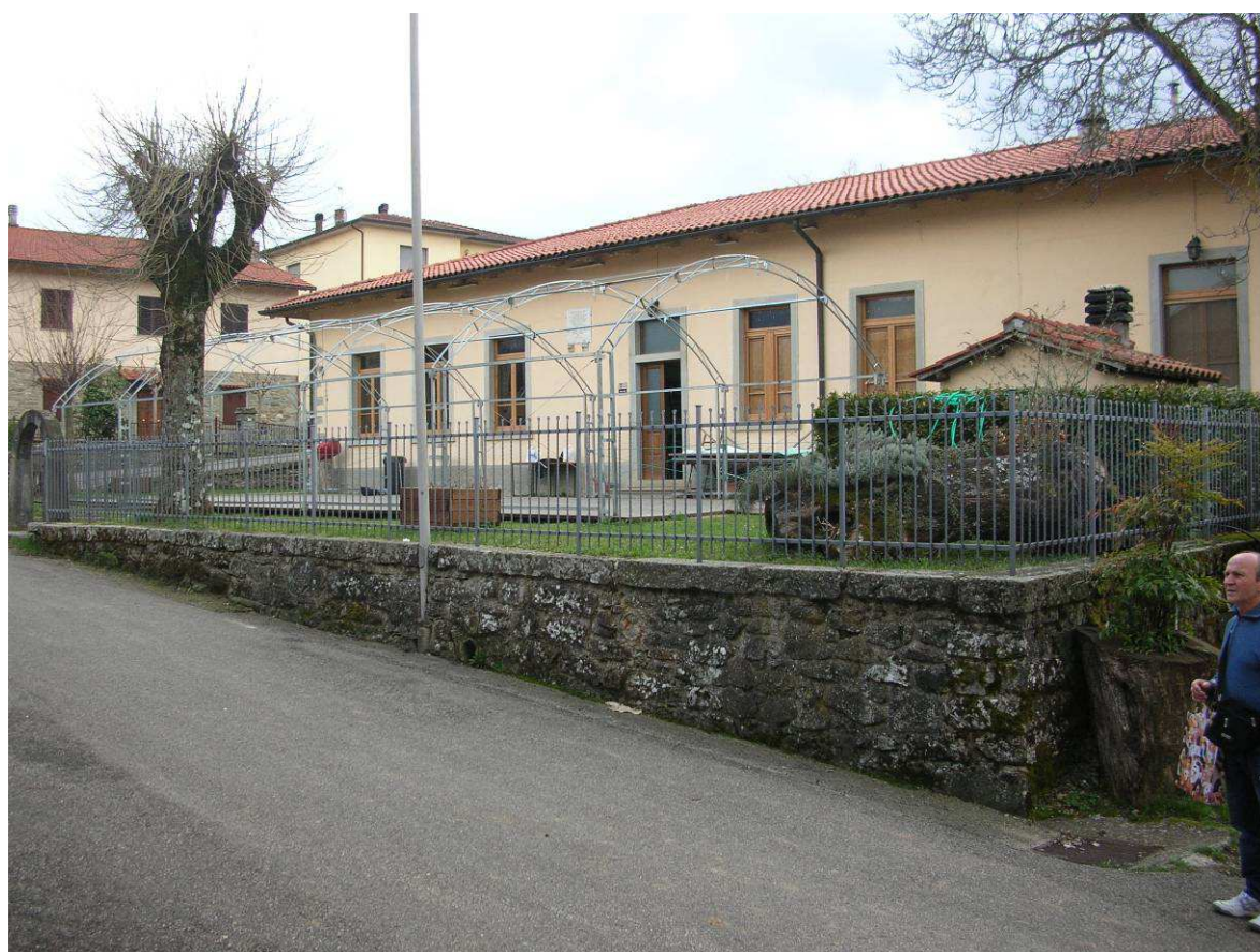
Area Ricovero Popolazione 03R – Area verde e Sportiva Cetica – Ex Scuola